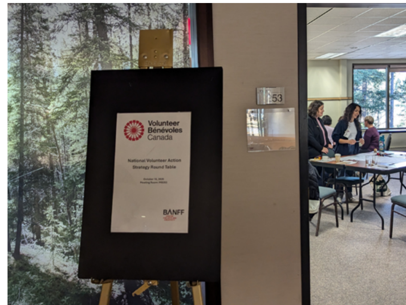
Table ronde de Banff en collaboration avec Volunteer Alberta, rendue possible grâce au soutien de la Fondation Canada Vie.