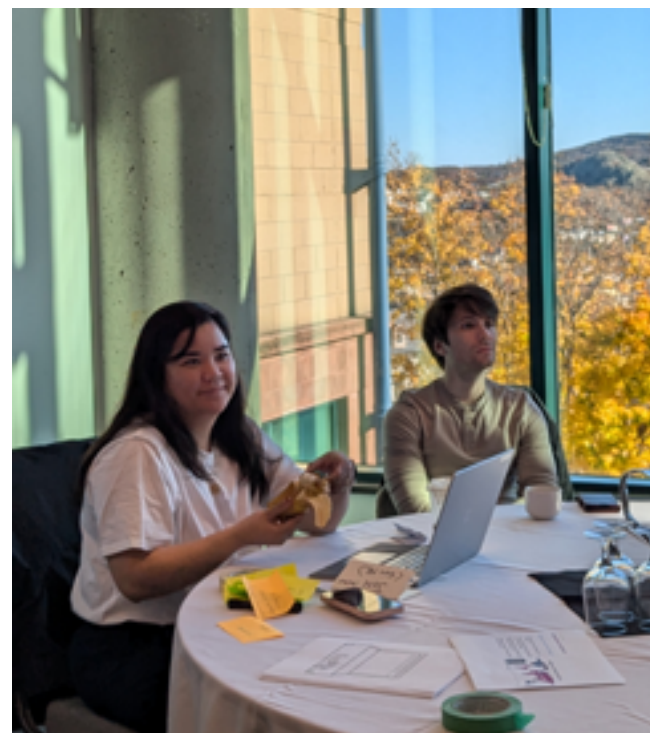
Réunion du comité Le bénévolat compte toujours organisée avec le soutien du CSCNL et de Volunteer Alberta et rendue possible grâce au soutien de la Fondation Canada Vie.

les systèmes qui se recoupent façonnent de plusieurs façons les expériences et les relations des gens par rapport au bénévolat.