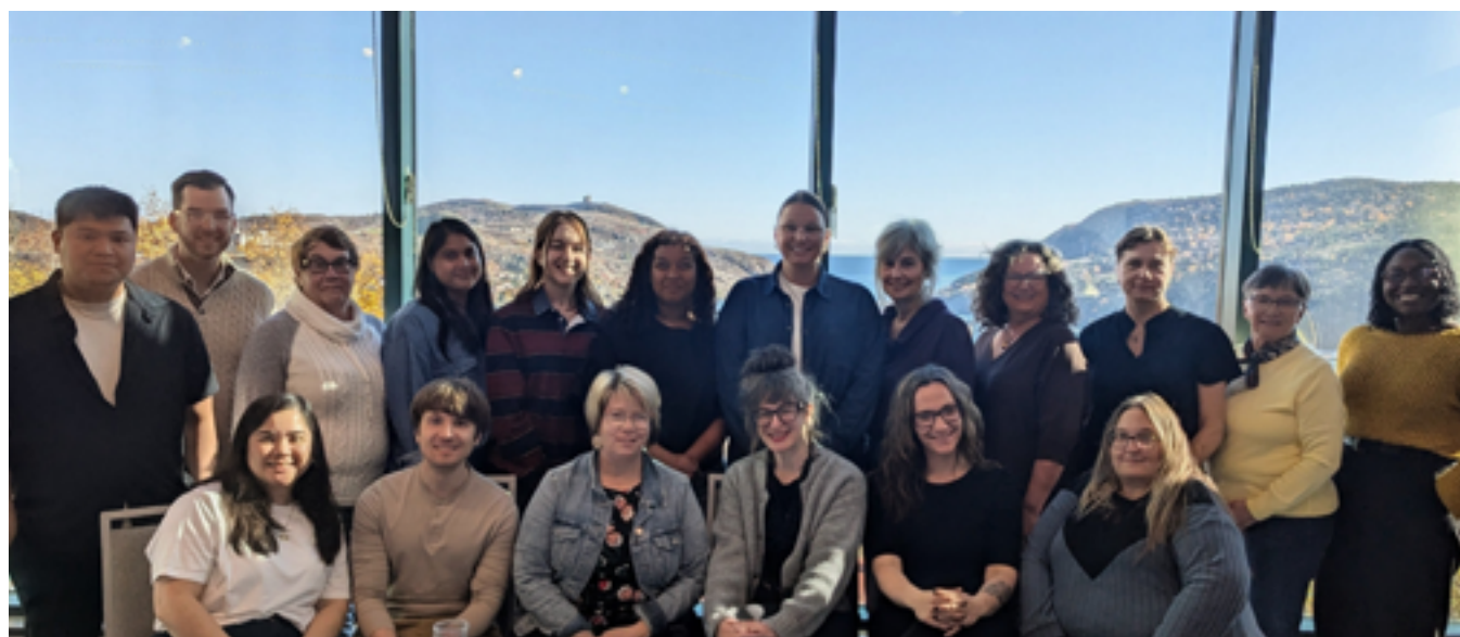
Réunion du comité Le bénévolat compte toujours organisée avec le soutien du CSCNL et de Volunteer Alberta et rendue possible grâce au soutien de la Fondation Canada Vie.

Bien que les gens semblent plus connectés numériquement, ils sont nombreux à ressentir une plus grande fragmentation sociale et à moins s'impliquer dans la vie civique locale. Le bénévolat a été identifié comme un mécanisme combinant un but, une relation et une contribution, et traçant une voie vers la confiance pour les personnes et les communautés. Nous avons entendu une demande pour plus d'honnêteté à propos des bienfaits personnels du bénévolat, y compris pour la santé mentale, l'identité, le sentiment d'appartenance et les liens sociaux.