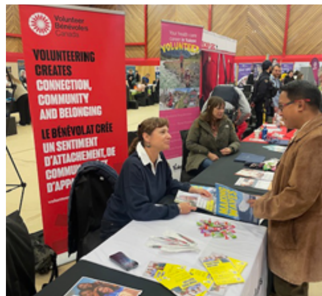
Bénévoles Canada à l'Expo formation, carrières et bénévolat organisée par Volunteer Bénévoles Yukon (VBV).

partenariats avec CSCNL, Volunteer Yukon, Volunteer Alberta et la Indigenous Community Safety Planners Community of Practice.