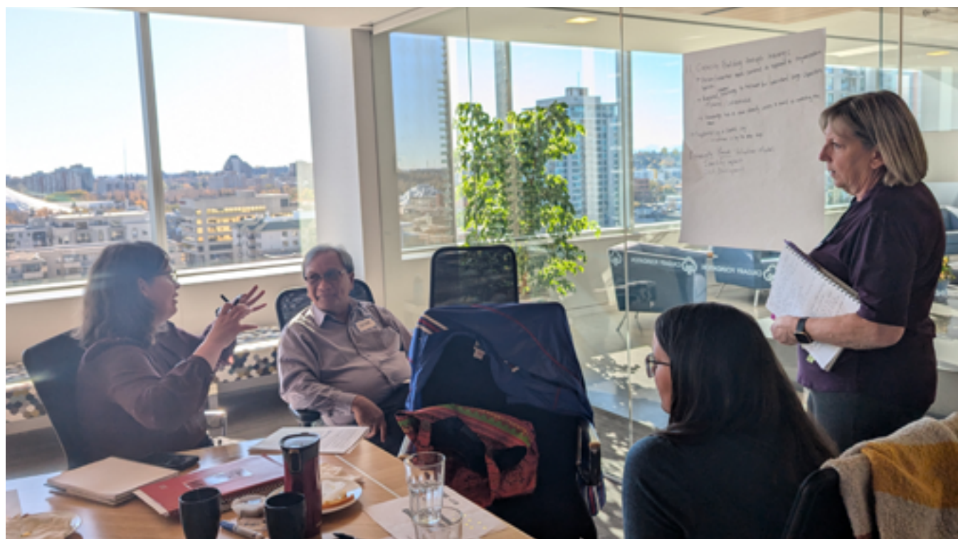
Table ronde de Calgary en collaboration avec Volunteer Alberta et la Calgary Foundation, rendue possible grâce au soutien de la Fondation Canada Vie.

Ces événements ont permis de commencer à mettre à l'essai les nouvelles recommandations et la Théorie du changement auprès de nombreuses organisations qui seront cruciales pour une mise en œuvre efficace de la stratégie.